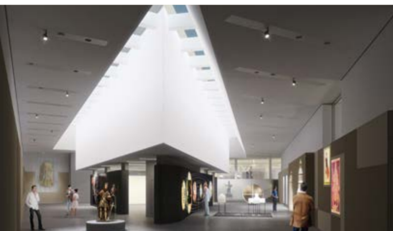
hks Architekten + Gesamtplaner

Het centrale informatiepunt van de Route Charlemagne is het Centre Charlemagne, het nieuwe stadsmuseum van Aken op het Katschhof, tussen stadhuis en Dom.